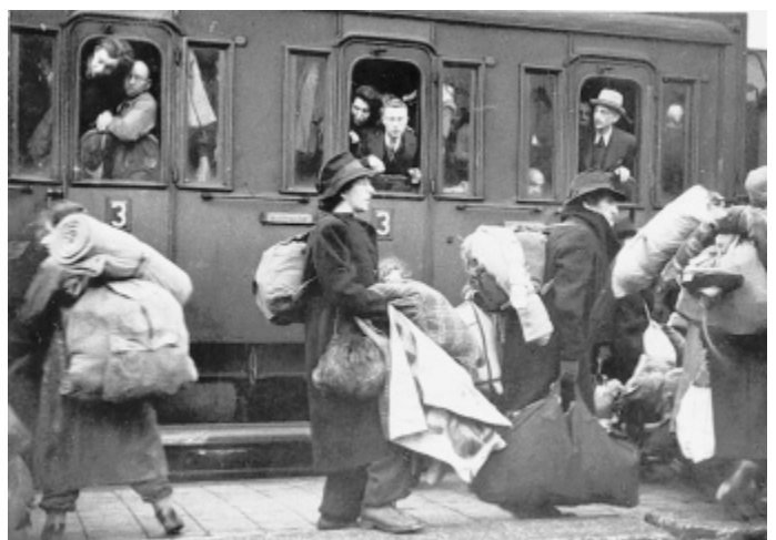
Zeitzeugnis: In Bielefeld im Stadtarchiv gibt es Fotos vom Deportationszug nach Riga am 13. Dezember 1941; da noch in Personenwagen, später nur noch in Viehwagons.

■ Bielefeld. Die nächste Märchenstunde im Bielefelder Bauernhaus Museum an der Ochsenheide ist am Sonntag, 31. Oktober, um 15 Uhr. Märchenzählerin Margret Oetjen liest das Märchen „Der Mond und das Mädchen“.